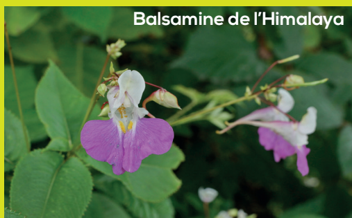
Balsamine de l'Himalaya

896 Données d'Espèces Exotiques Envahissantes