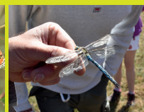
Les odonates sur l'ENS de Chastel sur Murat