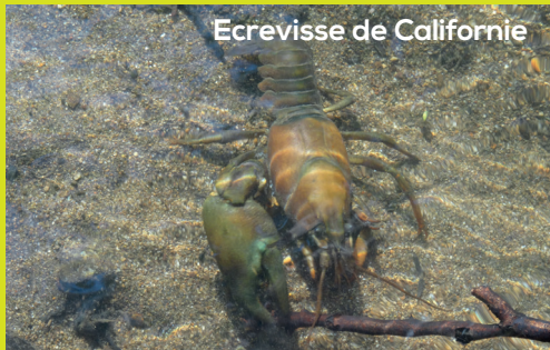
Ecrevisse de Californie