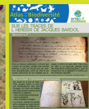
Sur les traces de l'herbier de Jacques Bardol - Saint-Flour