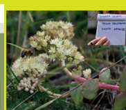
Sur les traces de l'herbier de Jacques Bardol - Saint-Flour