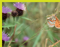
Les papillons à l'honneur sur l'ENS du Puy de la Tuile